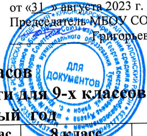
Таблица-сетка часов плана внеурочной деятельности для 9-х классов 2023-2024 учебный год