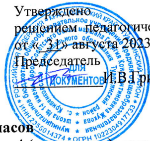
Таблица-сетка часов плана внеурочной деятельности для 4 ( казачьего) класса 2023-2024 учебный год