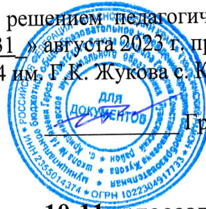
Таблица-сетка часов плана внеурочной деятельности для 10-11 классов на 2023-2024 учебный год