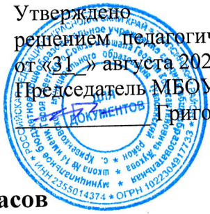
Таблица-сетка часов плана внеурочной деятельности для 7-х классов 2022-2023 учебный год